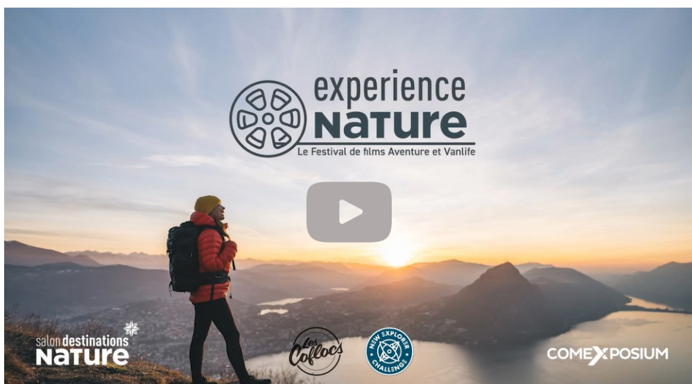
Teaser Experience Nature—le Festival de films Aventure et Vanlife

Au programme trail, trek, grands espaces, aventures à vélo ou en famille, vanlife et tour du monde!