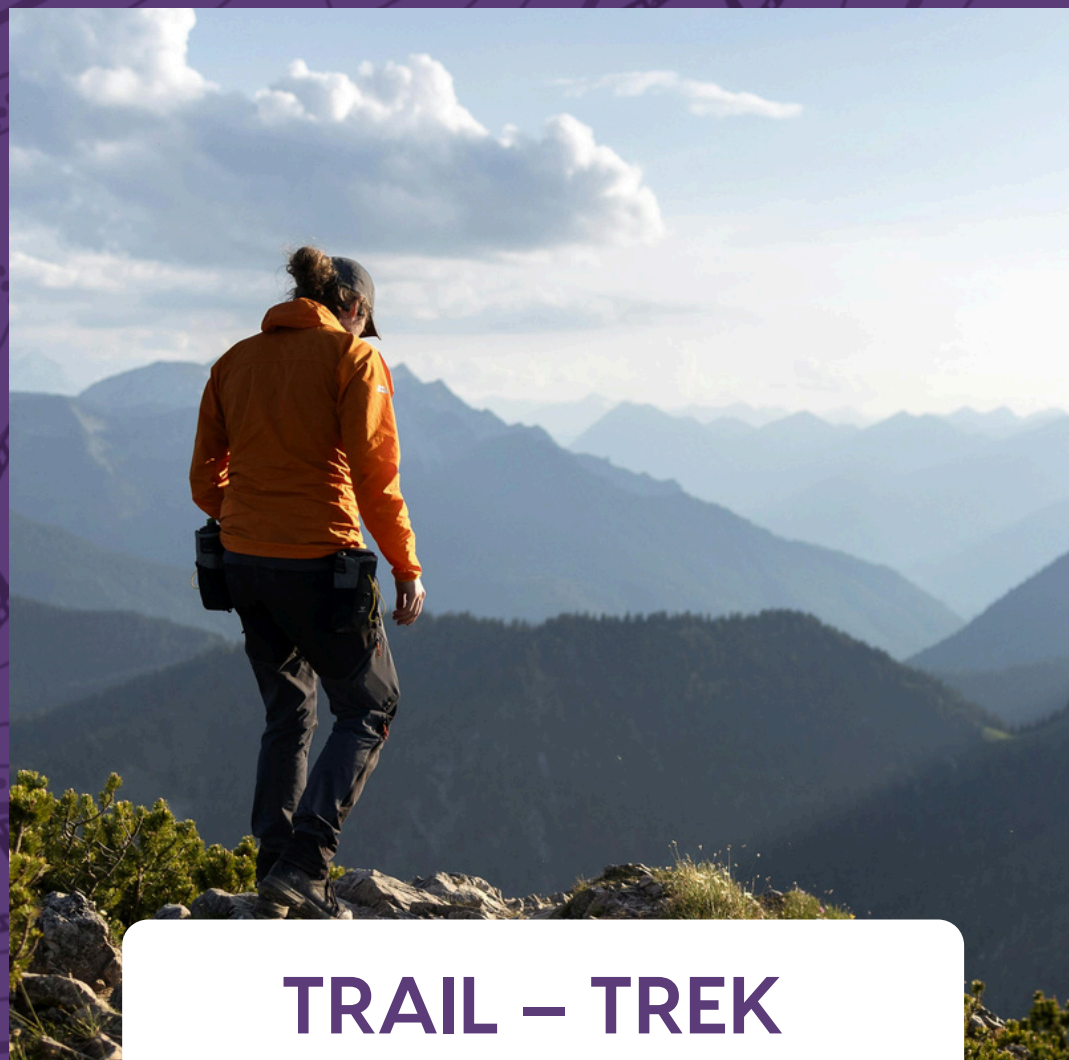
TRAIL – TREK GRANDS ESPACES