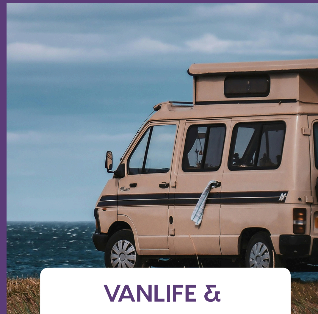
VANLIFE & TOUR DU MONDE