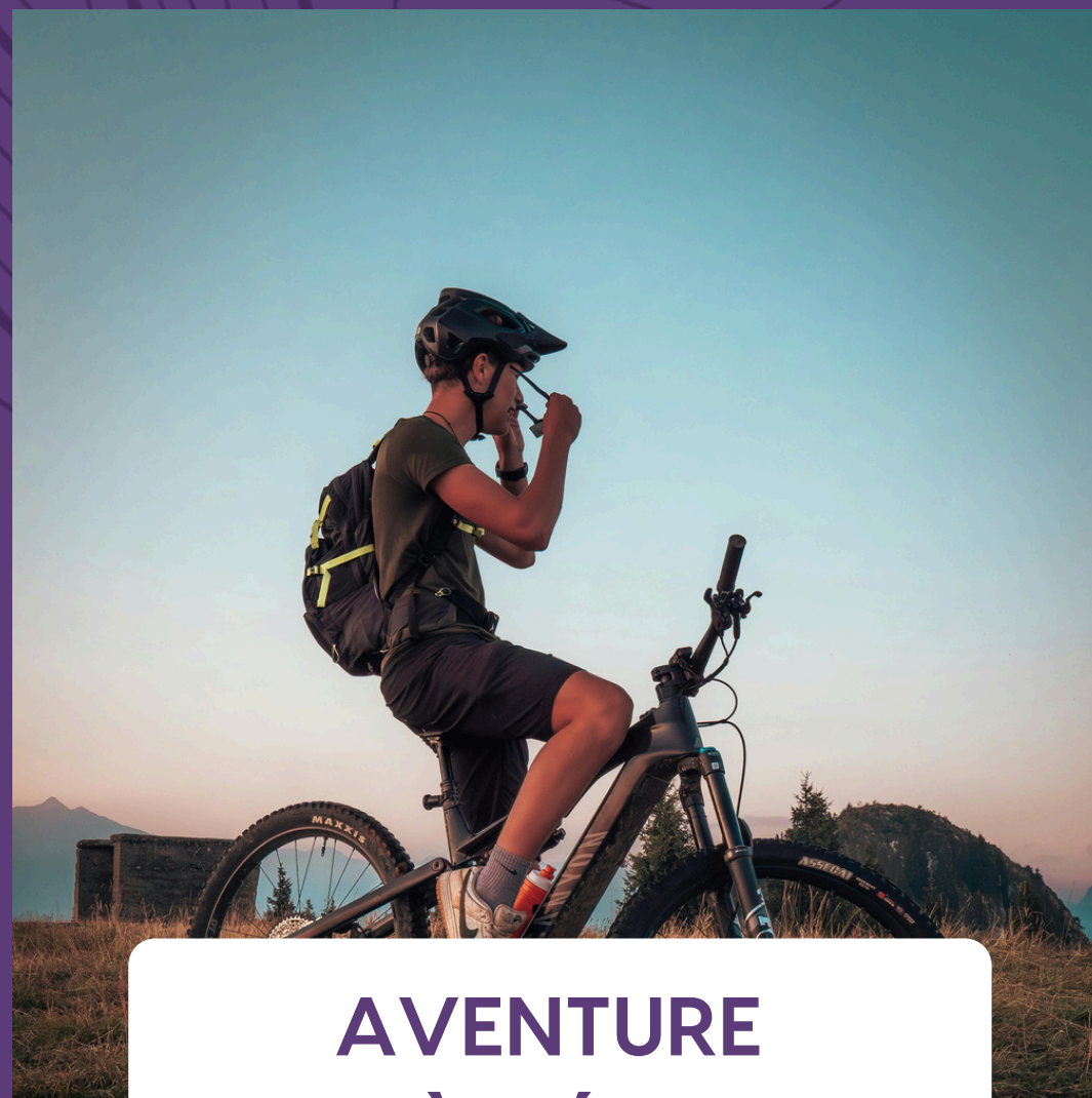
AVENTURE À VÉLO